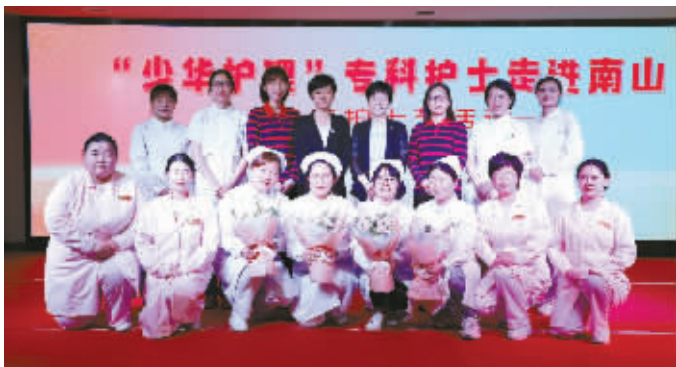
宁大附院和南山老年疗养院护理团队合影。