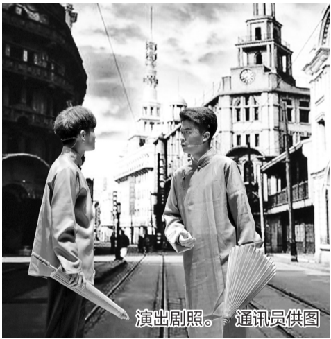
演出剧照。