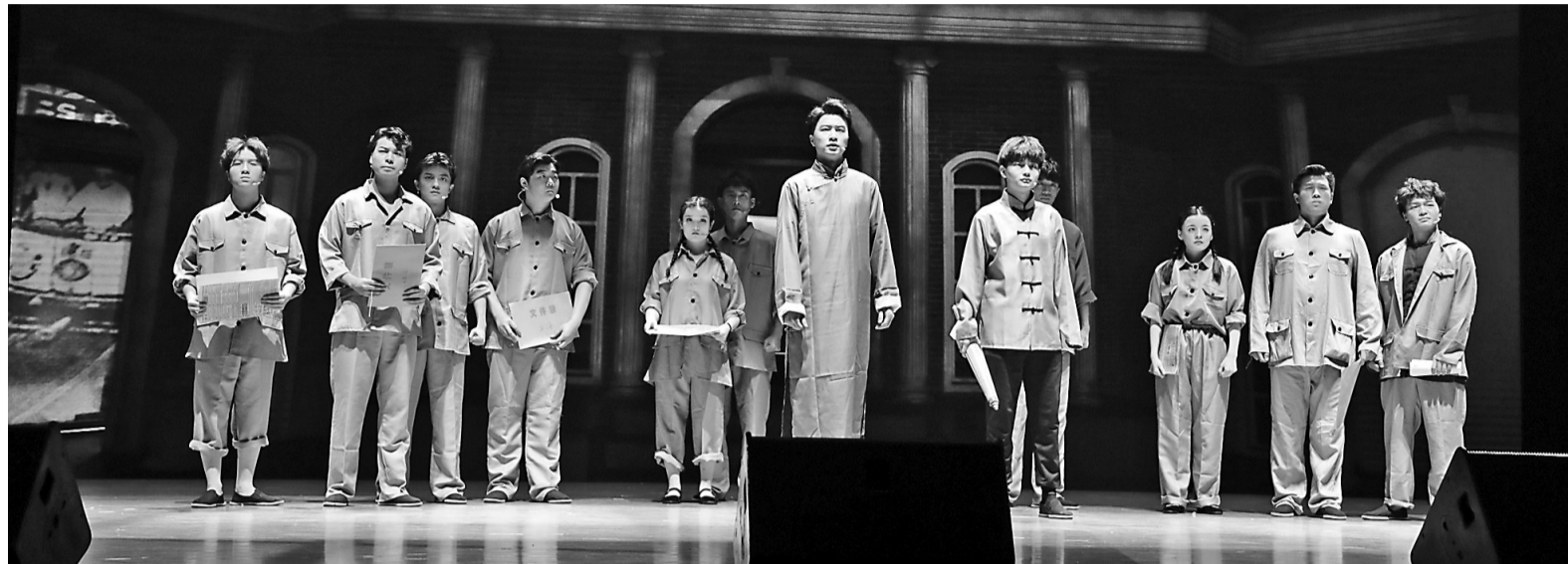
音乐剧《初心晨启·宣言》演出剧照。

“旧天地，大希望，换个新模样。走向前方，漫漫路长，会再击掌……”舞台上激昂的歌声，是上世纪20年代初无产者发出的时代吼声……昨日，由宁波大学音乐学院师生创作的红色音乐剧《初心晨启·宣言》在林杏琴会堂激情上演。