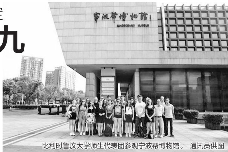
比利时鲁汶大学师生代表团参观宁波帮博物馆。

博物馆的文化影响力不断扩大，增强了海内外宁波帮人士的凝聚力和向心力，宁波帮博物馆作为“情感地标、精神家园”的创馆主旨也得到充分发挥。