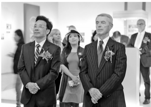
“勒马尚与宁波的三十年情缘特别展”开幕式。