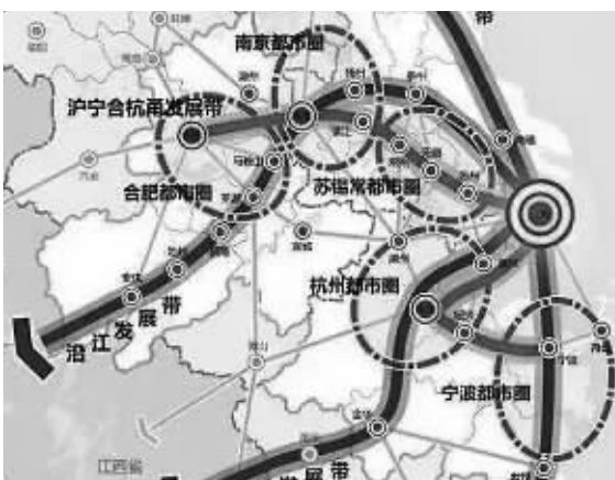
五大都市圈方位图