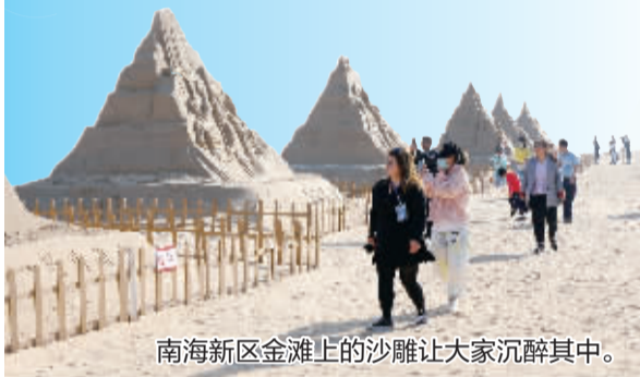
南海新区金滩上的沙雕让大家沉醉其中。

5月25日至27日,由山东省威海市文化和旅游局、威海日报社共同主办的全国百家媒体总编威海采风行活动举行。首批参加活动的媒体人——来自新华社、环球网、人民网、《中国旅游报》等国内主流媒体及来自南京、宁波、郑州、许昌、廊坊、恩施、商丘、濮阳、济源等山东省外媒体和《大众日报》《山东商报》等山东省内媒体的总编、名记者们,相继在威海市的环翠区、高区、经区、荣成、南海新区、临港等区域采风,“打卡”精致城市,感受幸福威海,游历“醉”美山海。