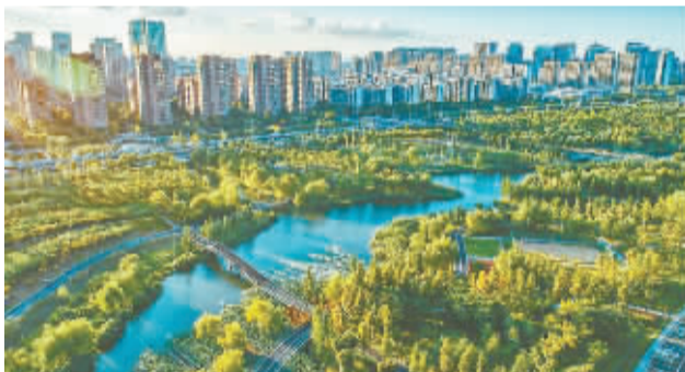
滨江休闲线实景图·东部新城生态走廊。