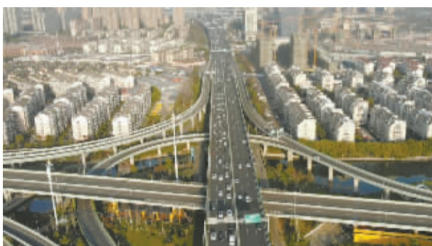
鄞州城市高架天际线实景图。

目前,城市高架天际线西段(芝兰桥-世纪大道)两侧第一排建筑景观改造提升工程已全面展开,夜景照明提升工程已基本完工。这两项工程将在明后年陆续完工。