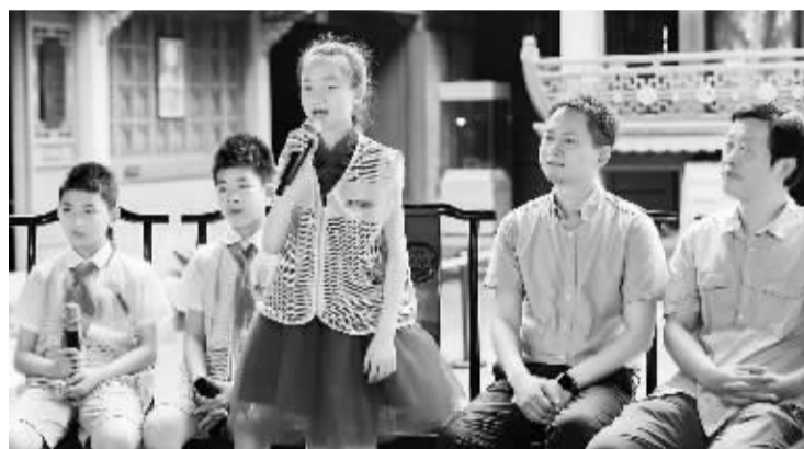
宁波庆安会馆活动现场。

本报讯(记者 顾嘉懿 通讯员 杨晓维)作为中国大运河重要组成部分,长达200多公里的浙东运河,起于杭州滨江区西兴钱塘江渡口,终于宁波甬江入海口,串联起杭州、宁波两座城市。