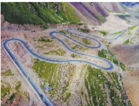
在较短的路程中要实现大落差下降，唯有“发卡路”才行。