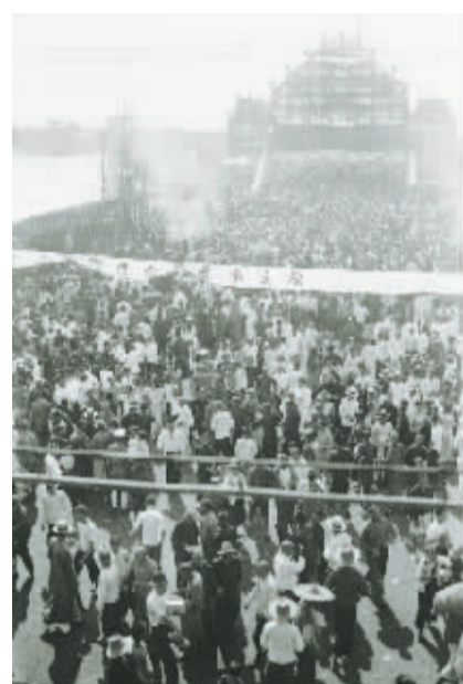
老照片:1936年6月27日,灵桥举行通桥庆典,市民纷至沓来。