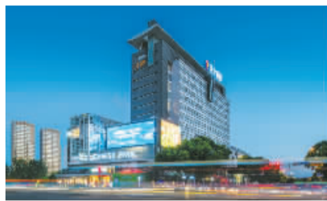
老照片:1931年2月开市的灵桥门菜市场。上世纪30年代初,宁波增设5处菜市场:灵桥门、西门、鼓楼、江北、新河头菜市场,其中灵桥门菜市场规模最大。(左图) 如今这里是芝士公园。(上图)