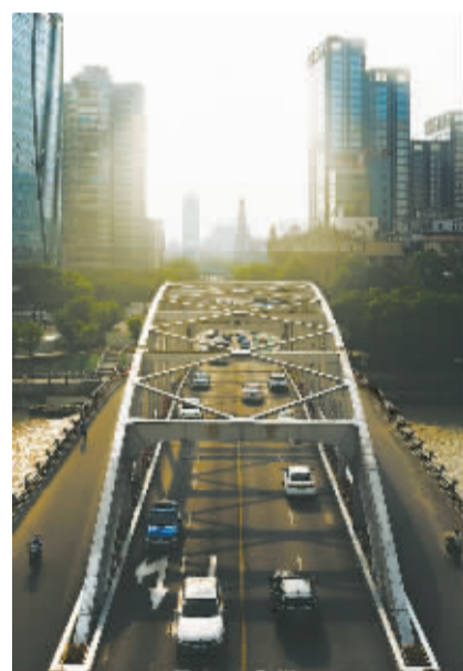
灵桥经过几次大修,一转眼,已陪着宁波人民走过85年。