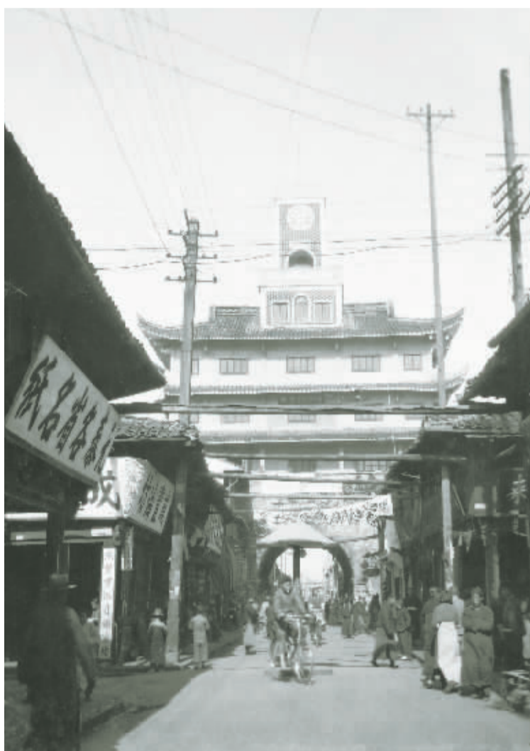
老照片:这是1934年的鼓楼,始建于唐长庆元年,经历多次损毁和重建,顶上的水泥瞭望台是1930年新造的,用于报时和报火警。(上图) 今天的鼓楼,建筑看起来和当年变化不大,它被保护得很好。(左图)