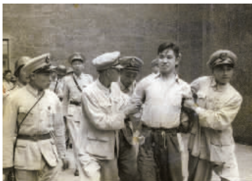
在法场上,王孝和留下了信仰的微笑。

今年6月24日,鄞州区福明街道为王孝和拍摄的微电影——《信仰的微笑》首映。首映礼上,王孝和的女儿——73岁的王佩民视频连线,感谢家乡人民。“我的名字是我父亲留给我的唯一遗产,这些年,我一直在追寻他的脚步……”老人的话令人动容。