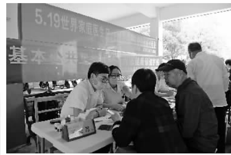
国科大华美医院专家加盟家庭医生团队,为签约居民服务。