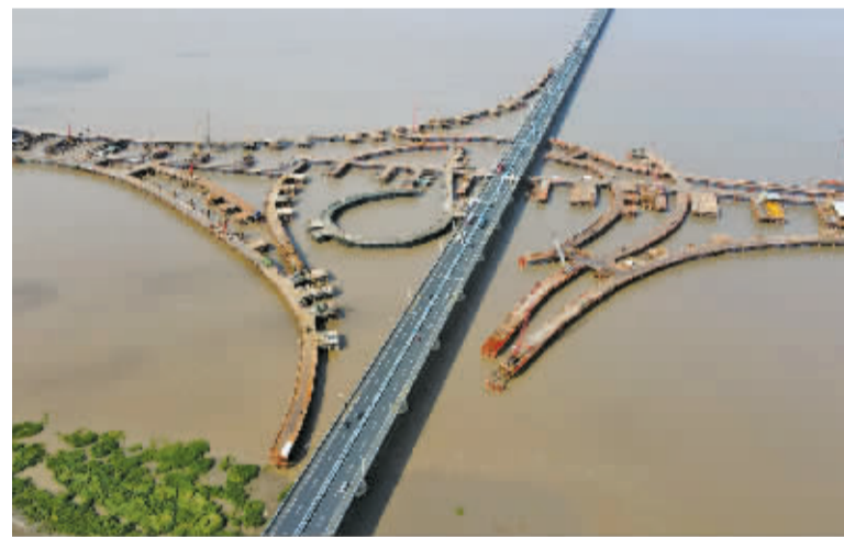
在建中的杭甬高速复线滨海互通。

7月15日,随着重达1450吨的整孔预制箱梁顺利通过老海堤连续梁,标志着杭甬高速复线海域箱梁架设正式启动,项目建设再次按下“加速键”。