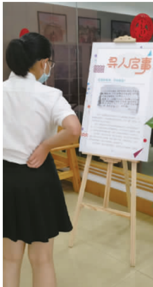
读者在图书馆寻人启事展板前驻足观看。