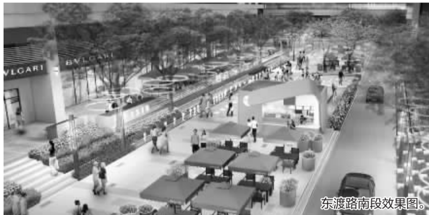
东渡路南段效果图。

记者昨天从相关部门获悉,海曙东渡路街区即将启动更新改造,工程预计2022年6月初完工。