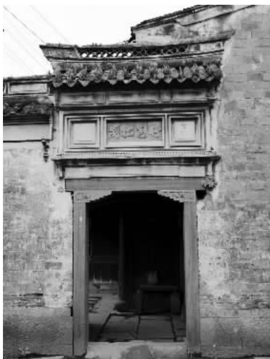
“竹苞松茂”的砖雕门额

1000多年前,四明山东麓有个“广纵千顷”的广德湖,是当时的鄞西人民赖以生息的母亲湖。据《四明谈助》记载:“自东港口抵望春桥,西至西港口抵林村,南至南港口抵清店蒋山湖后,其北则自北港口出至高桥之南。”这面积相当于今天的东钱湖的四倍。我们要去的凤岙,如今是浙江省历史文化名村,旧属鄞县桃源乡,在林村之南,是广德湖西岸的古村落之一。