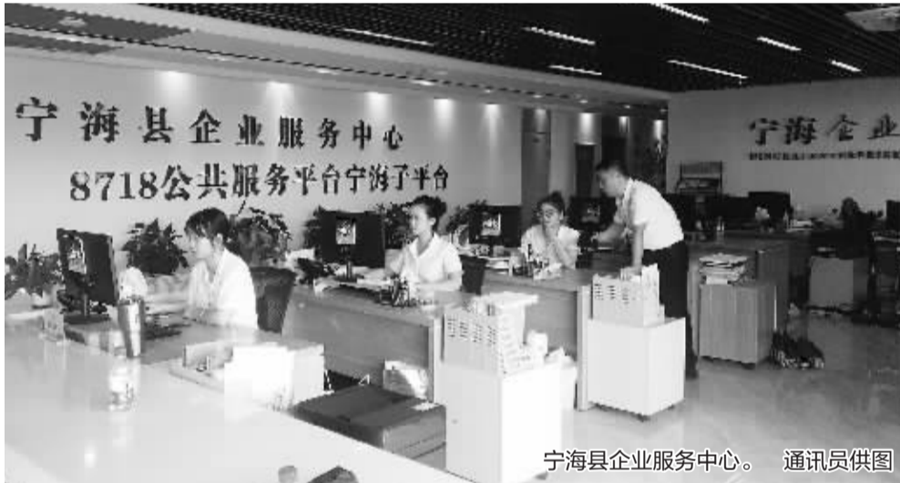
宁海县企业服务中心。

6年前,该县以政府购买服务的方式推出“企业服务”平台,致力于帮助广大企业排忧解难,解决问题。通过不断升级优化,如今“企服通”平台已吸引企业12000多家,年受理求助达1.5万余件,成为企业发展的好助手。