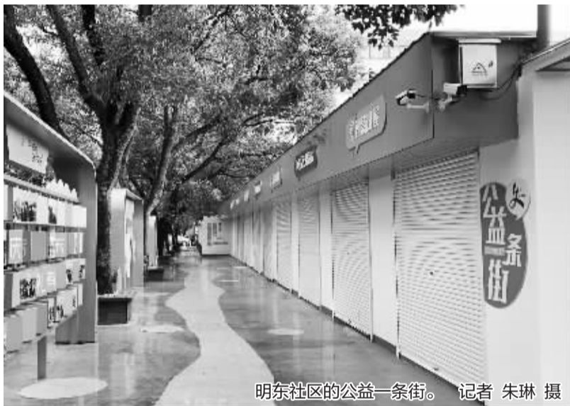
明东社区的公益一条街。