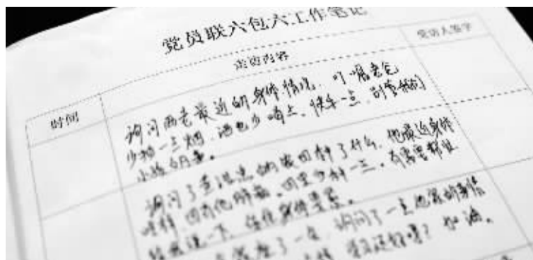
《党员联六包六工作笔记》记的都是“鸡毛蒜皮”,却事关农户的幸福生活。