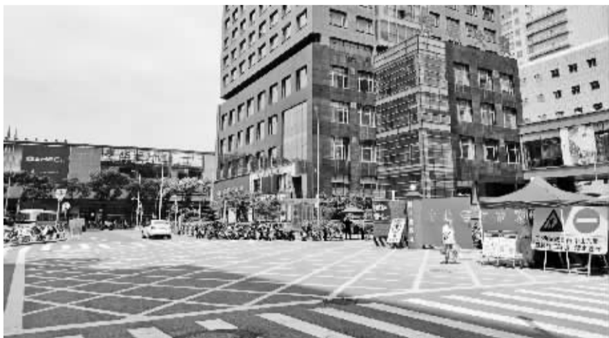
车轿街、咸塘街路口的黄色网格线上没有发现违停车辆。

昨天,记者回访以上现场,发现绝大多数情况得到了整改,相关部门也安排了专人值守和劝导。许多市民表示,希望能建立长效机制,整治不能“一阵风”,让文明渐成习惯。