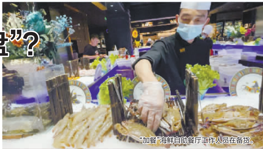
“加餐”海鲜自助餐厅工作人员在备货。

走进餐厅，取餐台上“在宁波，看见文明中国”“杜绝浪费”等宣传语随处可见；备餐区的工作人员忙活着，食物补充及时；客人取餐每人拿一只盘子，适量夹取。待客人离去，记者特地前往查看餐桌，基本都是光盘，海鲜壳吃得也很干净。