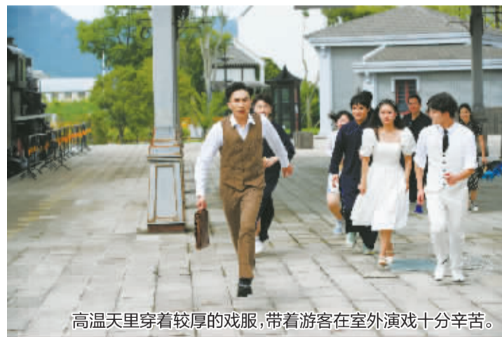
高温天里穿着较厚的戏服,带着游客在室外演戏十分辛苦。