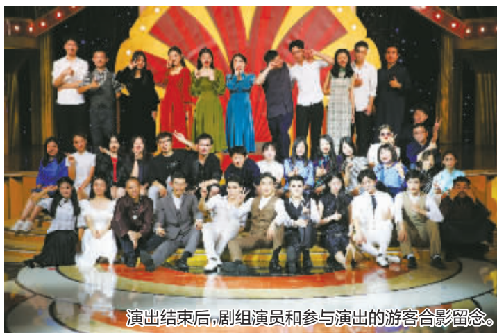
演出结束后,剧组演员和参与演出的游客合影留念。