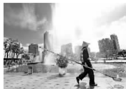
“席地而坐”城市客厅创建区域保洁。

区文化广场不仅实行16小时动态巡查保洁制度,按照城市家具及小品一日两擦、两消毒,硬质铺装清扫车一日一冲洗,专业清洗车精洗一周两次的频率开展深度保洁工作,还通过实施整体改造、构建立体景观、引入特色水秀等方式,打造了繁花似锦、可坐可观的“城市会客厅”项目,共计新增立体花卉600余平方米、草花面积2600余平方米、摆放16万盆时令花卉,组成磅礴大气的模纹花坛。同时,该区域还对原有音乐喷泉进行升级改造,夜间轮流上演15个水秀表演节目和5种动态水雕塑模式,与鄞州公园、南部商务区夜景交相辉映,为市民