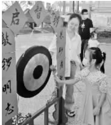
丹城第六小学学生敲响明志。