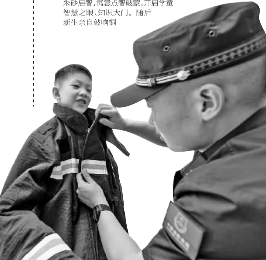
上海世外教育附属姚江书院，孩子们争当小小“消防员”。