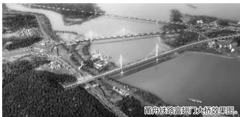
甬舟铁路高翅门大桥效果图。