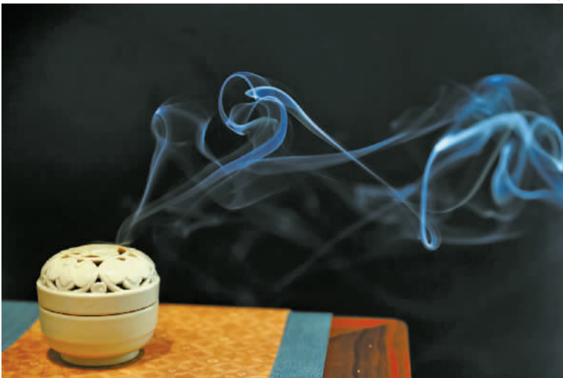
袅袅香风从香炉里升腾而起,低回悠长,如云似雾。