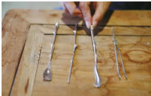
制作隔火熏香用到的银质器具。