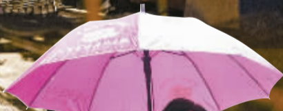
居民走在便民桥上。