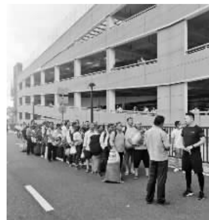
工友们正在被组织转移。