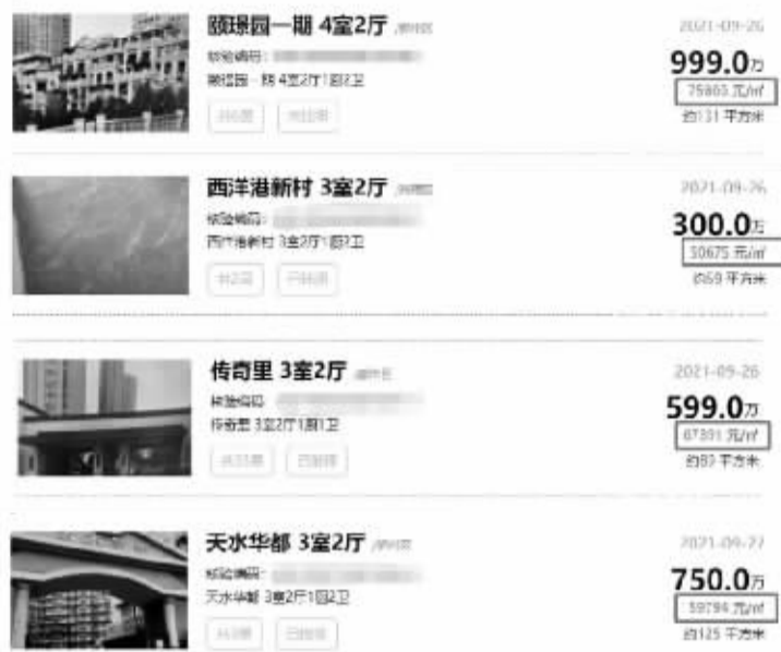
几套挂牌价格异常的房源截图