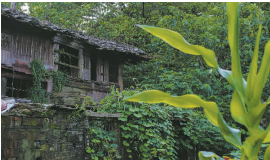
电台就藏在五姓村当年的保长家，非常隐蔽。