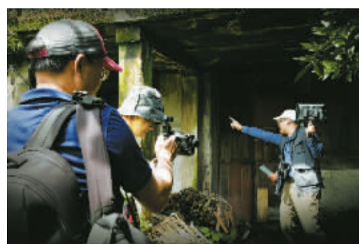
摄影师造访当年藏电台的地方。

也不敢进老百姓家，在牛棚里、坟洞里都躲过，到了晚上，村民便去送饭，就这样大家齐心协力，保护住了电台。