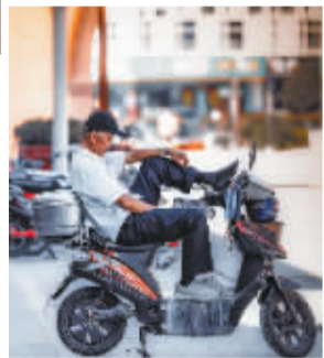
现在的城隍庙，已不复当年的人间烟火气，更多了一份庄重规矩。我们都是历史长河中的一个片段。