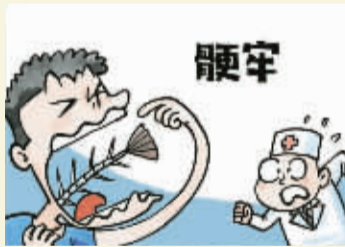
漫画：任山葳 配音：方芝萍