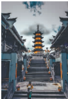
在城隍庙的中央区域，一座宝塔清晰地展现在眼前，这座宝塔，就是已经有一千多年历史的天封塔。天封塔共有7级，俗称七级浮屠。现为国家级文物保护单位。

城隍庙供奉的城隍神为汉将军纪信，据介绍，他曾是汉朝将军，赵人。曾参与鸿门宴，随刘邦起兵抗秦。由于身形和样貌恰似刘邦，在荥阳城危时假装刘邦的样貌，向西楚诈降，被俘。项羽见纪忠心，有意招降，但纪信拒绝。最终被项羽用火刑处决。