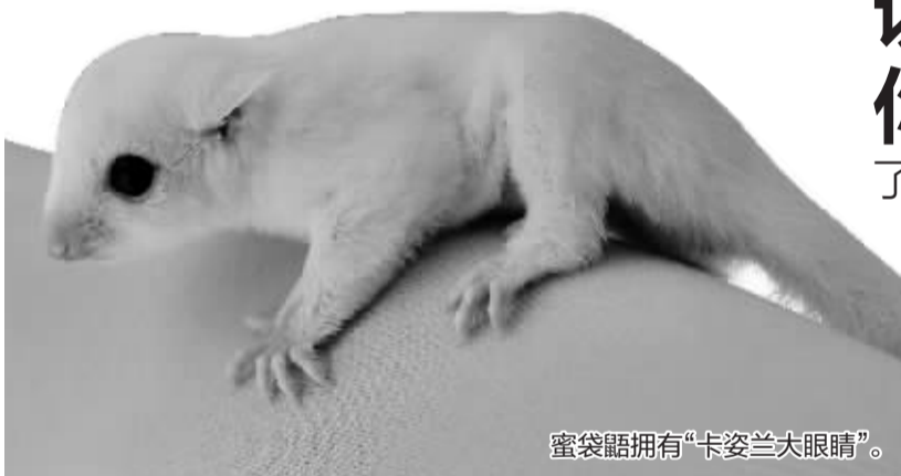
蜜袋鼯拥有“卡姿兰大眼睛”。