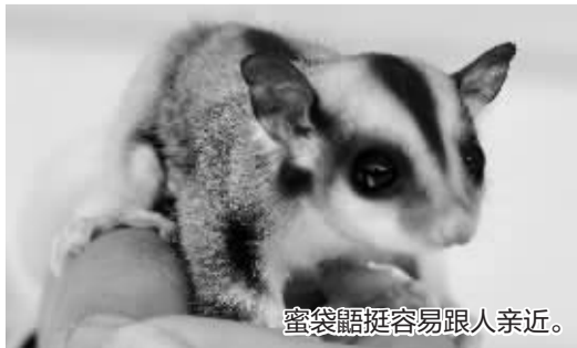
蜜袋鼯挺容易跟人亲近。