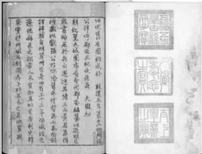
宋刻本宝庆志书影。