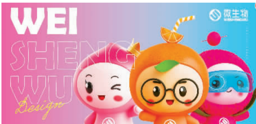
“微生物”线上购物平台全新IP形象“智慧果”亮相。

今年的浙江书展，恰逢中国共产党建党100周年，“十四五”开局之年，正处在我省高质量发展建设共同富裕示范区、加快打造新时代文化高地的关键时期。作为省委召开文化工作会议之后的首个全省性重要文化活动，它将如何在确保安全有序的基础上谋创新，在跨界融合中打开阅读生活新空间？记者采访了书展执行承办方负责人宁波新华书店集团党委书记、董事长郭靖。