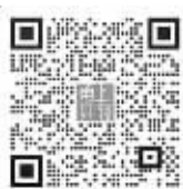
扫描二维码加甬上客服