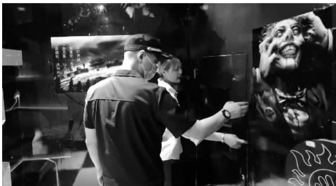
执法人员对密室逃脱场所进行检查。