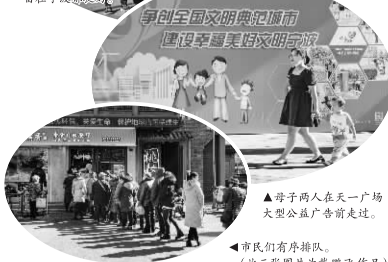
▲母子两人在天一广场大型公益广告前走过。