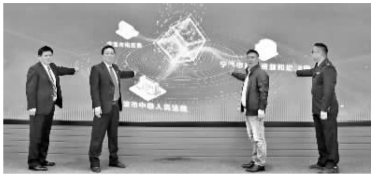
“一件事”“零次跑”改革启动仪式现场。

宁波司法网拍不动产登记“一件事”办理平台，打造了一条从不动产拍卖成交到权证办理的全流程闭环管理路径，流程主要包括税费函询、移动微法院引入、发起嘱托、税款征收、办理权证5个步骤。首先，法院通过浙政钉向不动产属地税务机关发起税费函询，拍卖成交后，将买受人引入移动微法院确认相关信息。随后，法院从移动微法院调取司法文书，发起不动产权证办事项嘱托，由属地不动产登记中心通过平台向税务部门推送相关材料。接着，税务部门进行税费计算和申