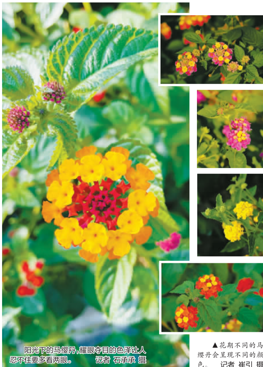
阳光下的马缨丹，耀眼夺目的色泽让人忍不住要多看两眼。

鹅黄色、橙黄色、鲜红色、玫红色……几乎每个花球都会呈现好几种颜色，而且每种颜色都仿佛经过精心