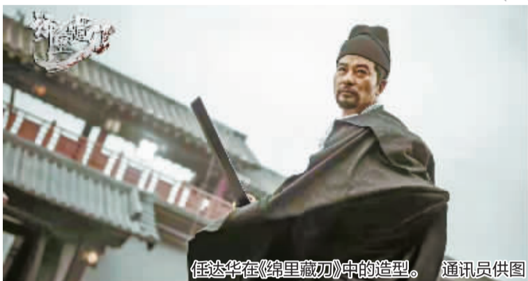
任达华在《绵里藏刀》中的造型。

1955年出生的任达华按说早已到了该退休的年纪,但他依然还在忙着拍戏、为新片宣传。最近这段时间,他就一直在象山影视城拍摄古装悬疑电影《绵里藏刀》。影片刚刚杀青,还没来得及脱下戏服的他匆匆从片场赶来,接受了记者的采访。他亲和而又健谈,仅从外表和精神状态看,你很难猜出,这位老戏骨今年已经66岁了。