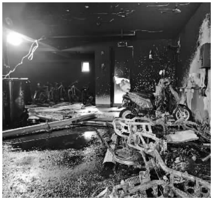
大火过后,3辆电动自行车只剩下车架。

小区楼下凌晨失火,3辆电动自行车被烧毁,百余名业主紧急疏散……昨日上午,消防部门通报了日前发生在高新区交通紫园的一起火情,对物业的及时反应予以肯定。同时,对该小区一些业主关于“是否都要疏散”的讨论进行了回应。