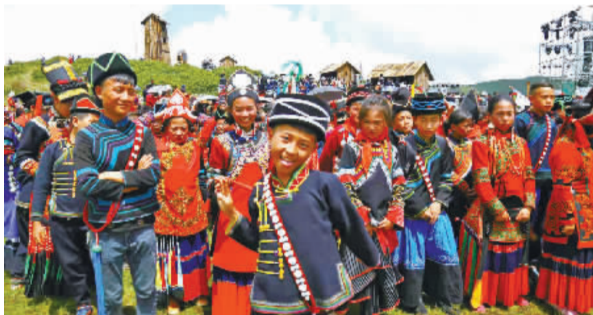
火把节,彝族娃娃最高兴。