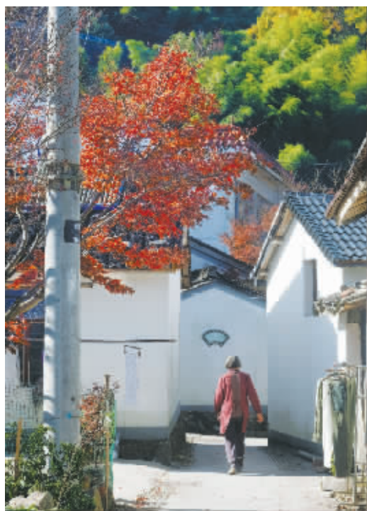
巷子里随处可见红枫斑斓的色彩。

北溪村的天然美意让人不胜惊羨。无论春天看樱,还是深秋赏枫,或在村中探古访幽,北溪向来客展开的是一幅浓缩着四明风情的山水长卷。