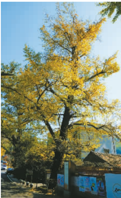
两棵树龄600多年的古银杏。