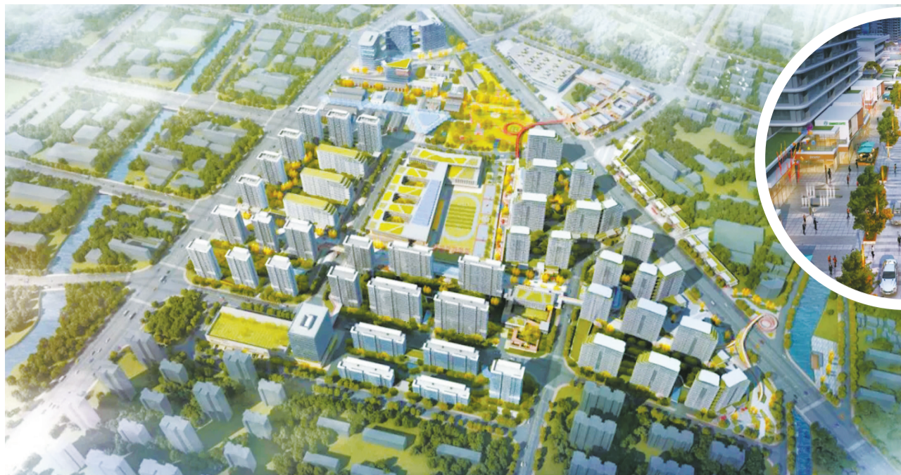
天鑫未来社区整体鸟瞰效果图