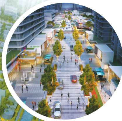
未来社区邻里特色商业街效果图