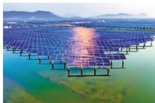
这是宁海县梅林街道杨梅岭水库，有人半生才走出山外，看山山水水从车窗前掠过，感觉时光在倒带。