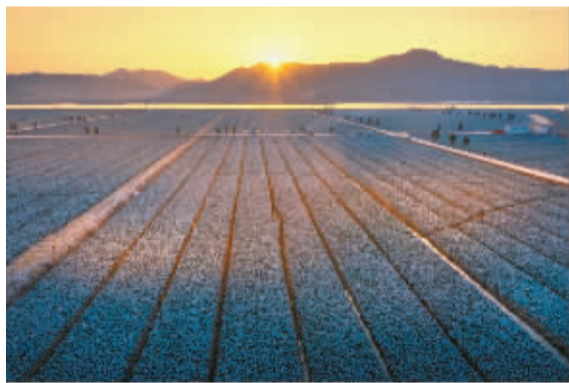
春天适合思念，冬天适合见面。这一年没有说完的话，留到冬天慢慢说。