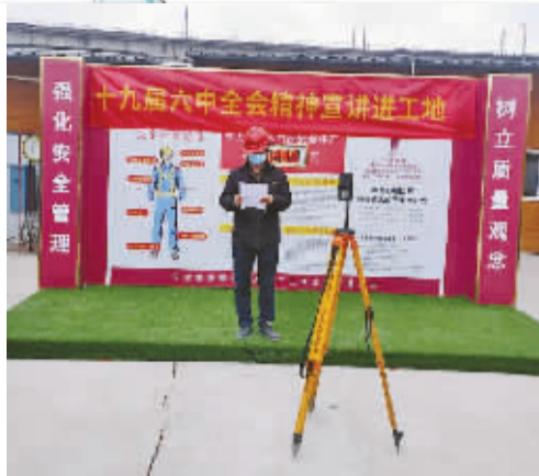
临时党支部直播宣讲。