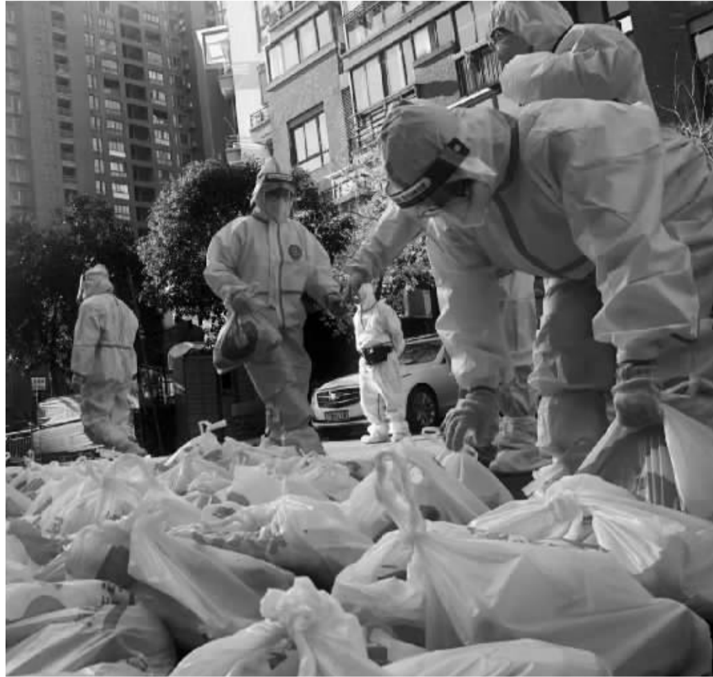
小6买菜员工在配送蔬菜肉禽。