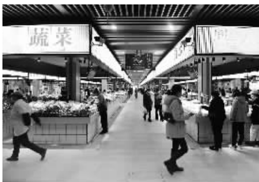
昨日,市民在北仑星阳菜市场买菜。

走进北仑星阳菜市场,看到的是整洁的环境、专业的检测室、垃圾无害化处理设备以及各种大数据的实时展现。作为宁波首个被评为浙江省五星级的农贸市场,这里展现的是宁波近年来对农贸市场整体提升改造的一个缩影和样板。