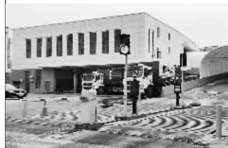
改造后的双杨垃圾中转站。