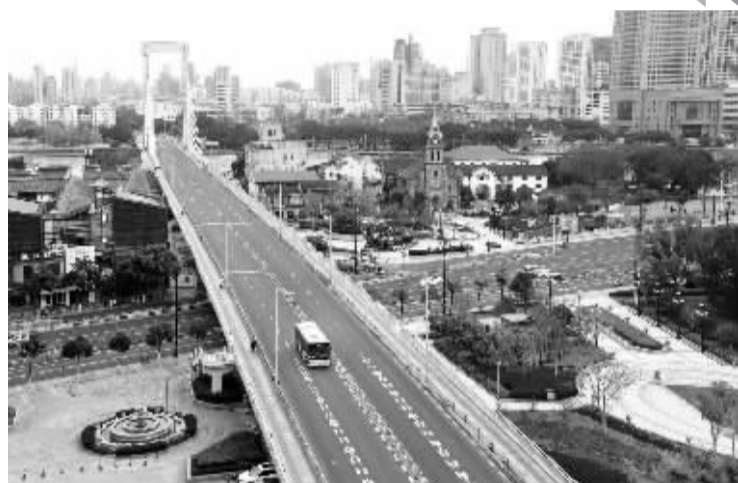
宁波的公交车已成为城市一道靓丽的风景线。

在宁波东部新城海晏北路地铁站旁，路边的共享电单车码放得整整齐齐；人行道前，每当有行人通过，公交车都会主动停下，示意行人先过，公交候车亭则被擦洗得一尘不染。公共交通设施，驾驶员与行人之间的和谐，与整洁的道路、美观的公益广告、生机盎然的绿化景观融为一体，形成了街头一道道流动的风景。大家都说：“这才是城市交通出行该有的样子。”