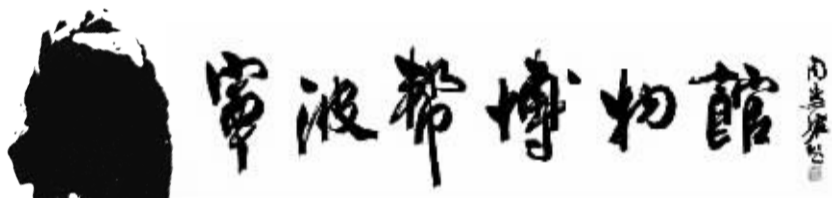
“宁波帮博物馆”馆名由周慧珺题写。

据周慧珺书法艺术馆消息，中国书法家协会原副主席、上海市书法家协会原主席、宁波籍著名书法家周慧珺，27日上午在上海家中安详离世，享年83岁。