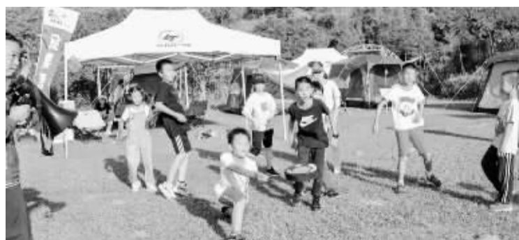
今年十一期间,四年级的小伙伴一起参加露营活动。