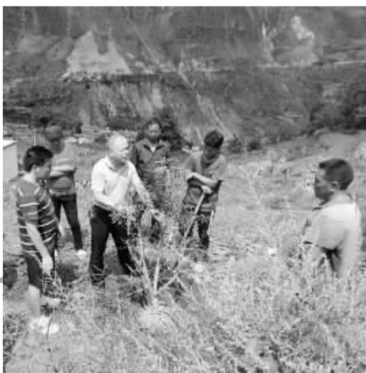
余姚水果专家在凉山指导杨梅引种。吉伍阿龙 摄