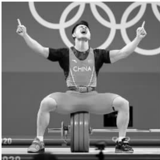
7月28日,东京奥运会举重男子73公斤级决赛,石智勇夺冠。