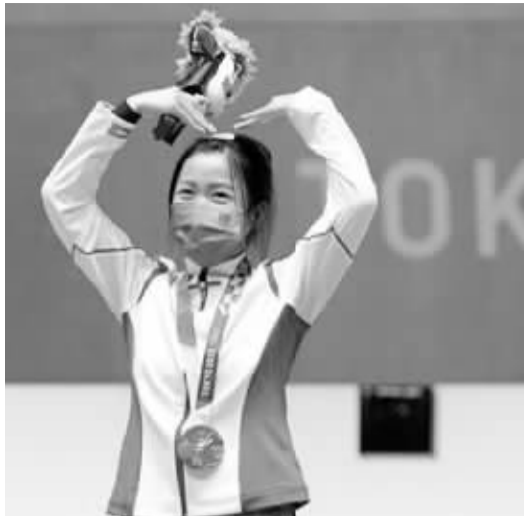
7月24日,杨倩在东京奥运会颁奖仪式上。