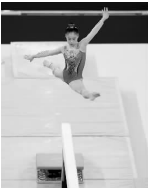
8月3日,东京奥运会女子平衡木,管晨辰夺冠。